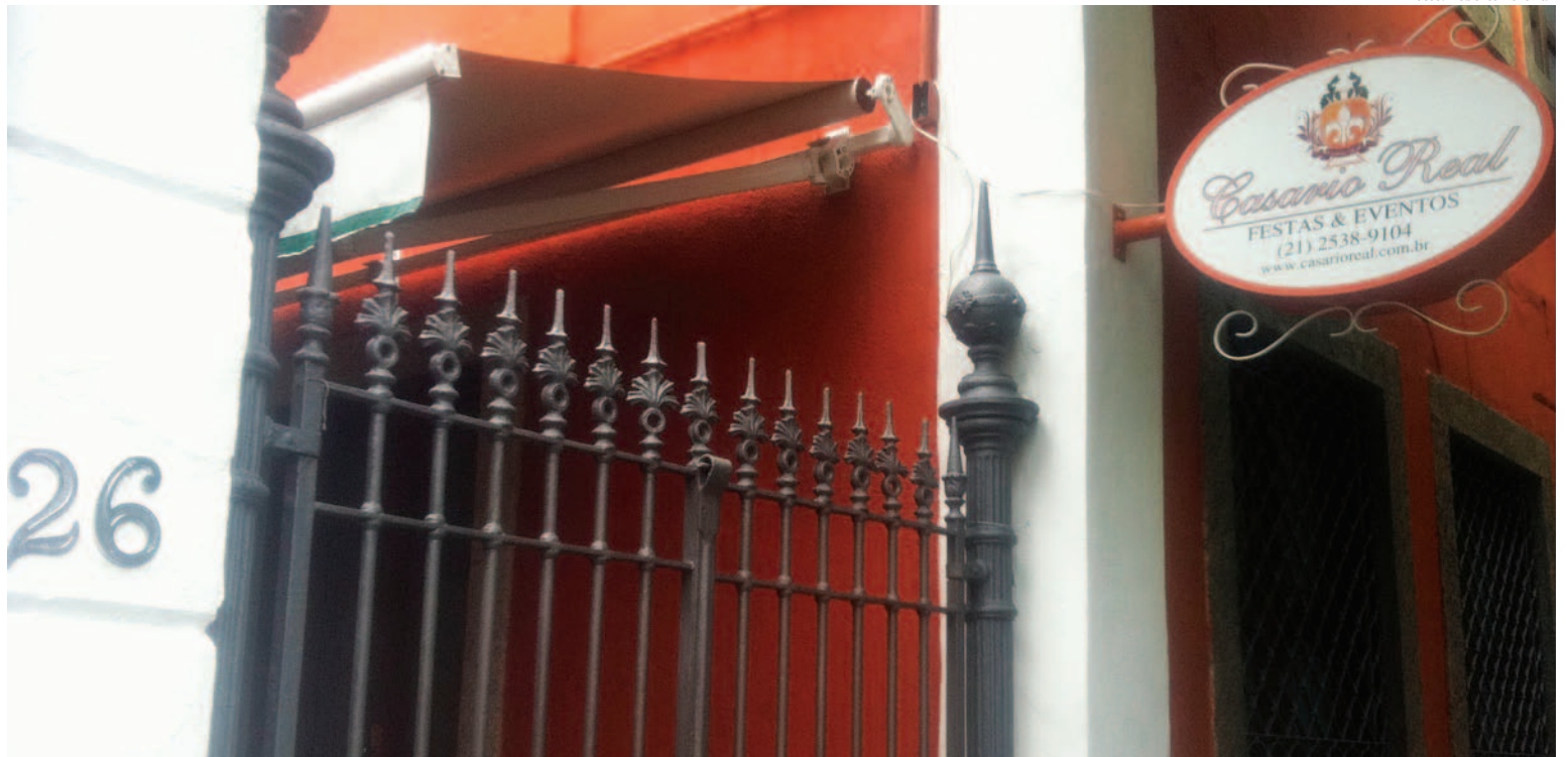
Apesar de se anunciar com um local para “Festas & Eventos” na realidade tem funcionado como boate