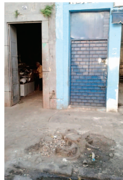
A árvore, que ficava na altura da Rua Sorocaba 597, sofreu durante muito tempo com o caminhão que pega lixo do ferro-velho e acabou morrendo