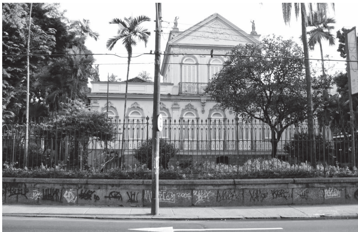
Sua sede com seus jardins imponentes são um marco no bairro de Botafogo