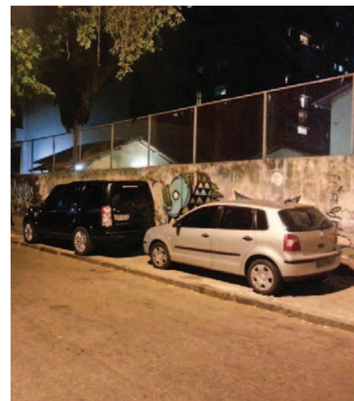
Mendigos, lixo, estacionamentos não permitidos são mais alguns exemplos do total abandono do poder público nesta área

ocupados com o descaso da Prefeitura em relação ao problema da má utilização do espaço público. Estamos estudando como nos organizarmos melhor, para divulgar ainda mais o problema e pressionar as autoridades a fazer o trabalho que lhes corresponde por obrigação. Pessoalmente, pretendo editar um pequeno vídeo com as fotos e publicá-lo no You Tube. Essa tática tem se mostrado muito eficiente com outros problemas que nosso condomínio enfrentou no passado. Não esqueçamos que a Internet não reconhece fronteiras geográficas!