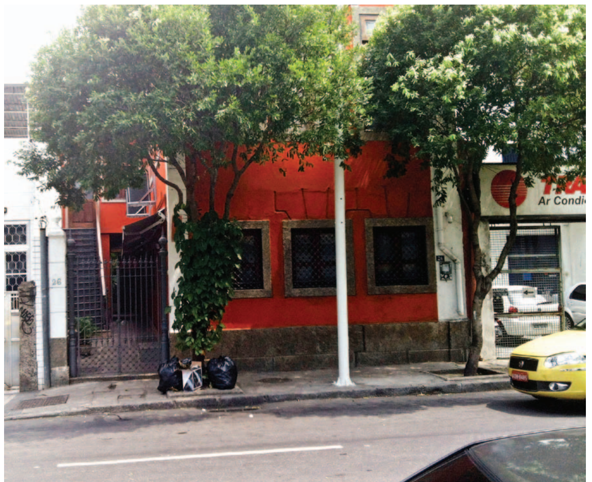
O Casario Real sobressai na vizinhança pela sua pintura forte em cor laranja

Aqueles que desejarem saber mais sobre os abusos que têm tirado o sono dos moradores da Real Grandeza e adjacências, basta conferir o blog http://casarioilegal.blogspot.com.br/ e apoiar a causa.