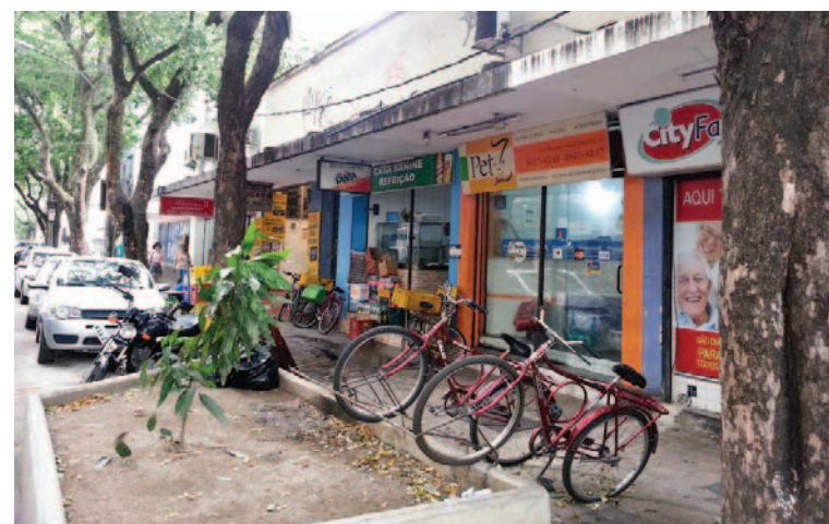
Os canteiros foram transformados em bicicletário e depósito de lixo