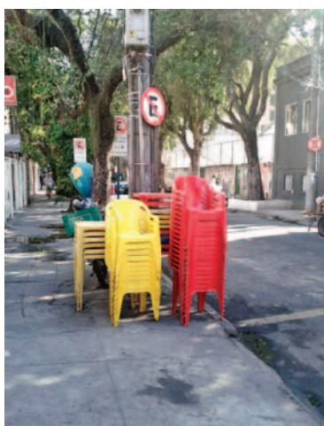
O Alfa Bar toma conta da calçada, de noite e de dia