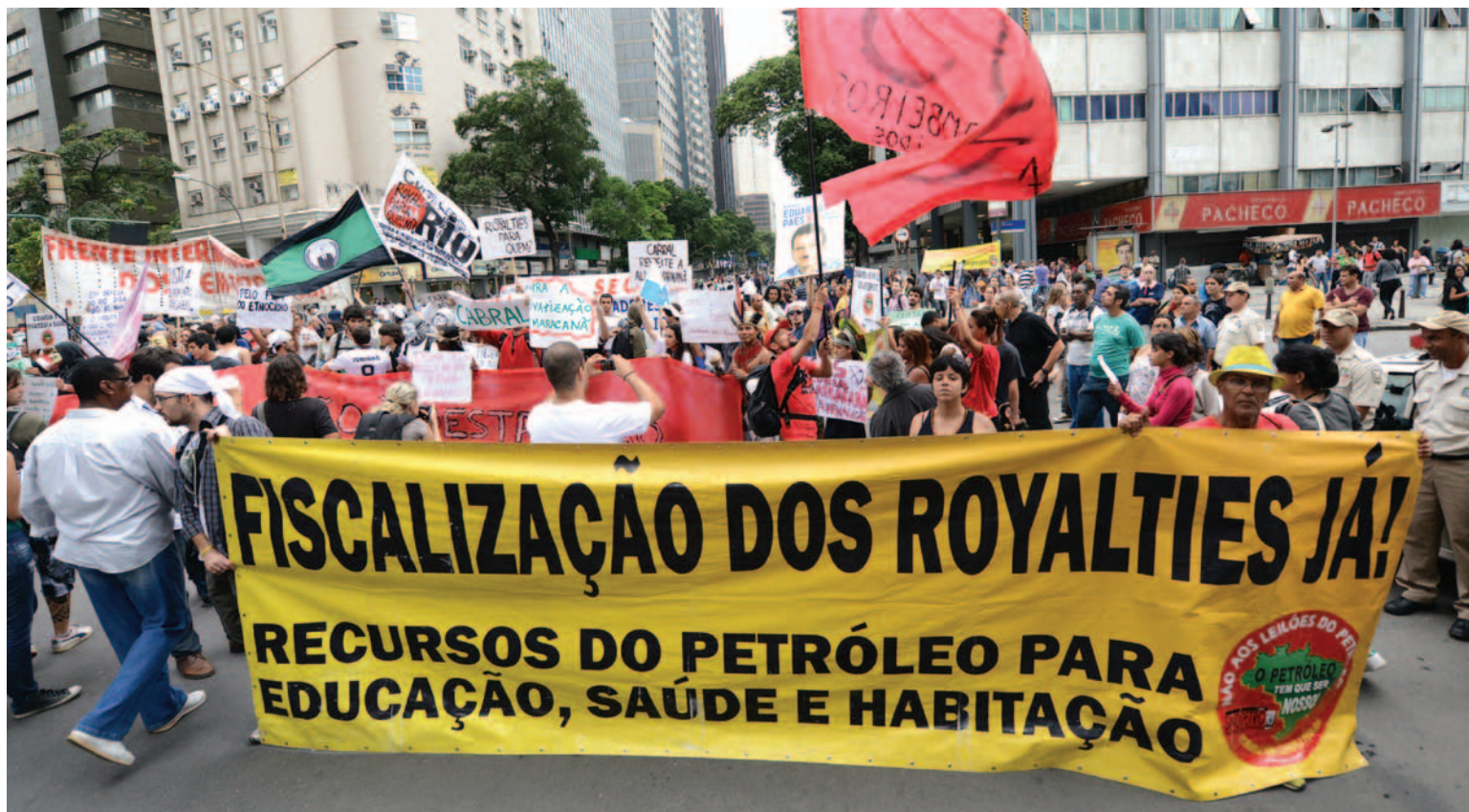
Campanha O Petróleo Tem que Ser Nosso faz contraponto ao ato chapa branca do governador Sérgio Cabral

Diversos movimentos sociais e ativistas questionam o discurso do governo estadual. Eles defendem que os estados e municípios produtores recebam uma parcela maior, mas que todo o povo brasileiro precisa ser contemplado. Além disso, cobram a ampliação do debate para toda a renda do petróleo e não apenas os 15% referentes aos royalties. Os outros 85% continuarão nas mãos das multinacionais do petróleo e do megabilionário Eike Batista ou serão destinados para resolver os graves problemas sociais que afligem nosso povo?